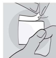
Rysunek 1: Otwieranie saszetki

Przed użyciem chusteczek należy dokładnie umyć ręce. Rozerwać saszetkę, aby ją otworzyć (Rysunek 1) i rozłożyć znajdującą się w środku chusteczkę. Nie używać żadnych narzędzi do otwierania saszetki.